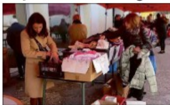
De bonnes affaires étaient à réaliser.

Mercredi dernier, l'unité cosnoise de la Croix-Rouge a proposé à l'extérieur de ses locaux sa dernière vente 2023, l'occasion aussi pour elle d'épuiser ses stocks.