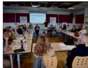
Habitants, associations et élus autour de la table.

Repartager Ce serait la consécration du travail engagé depuis 2020 autour de la participation citoyenne, une authentification du passage du vertueux dans les faits. Matière à rêver, tant la marche main dans la main des élus et agents communaux avec les composantes de la cité doit devenir réalité aujourd'hui, à Cosne-Cours-sur-Loire et ailleurs, si l'on veut éviter les frustrations. On fait pas que rester dans l'es-