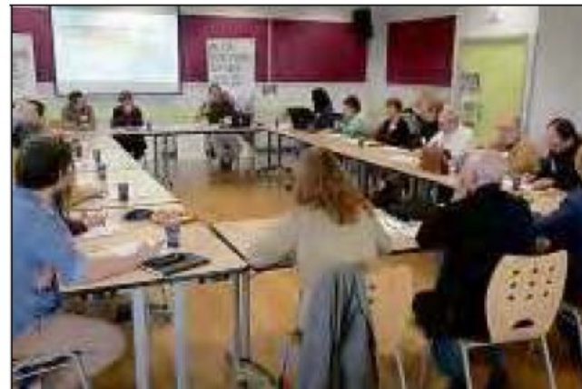
ÉCHANGES. L'assemblée a bien discuté et avancé.

« Deux ans après, il fallait se réinterroger sur l'engagement citoyen », précise l'élue. Trois thématiques se sont dégagées d'une consultation citoyenne via un questionnaire auquel une centaine